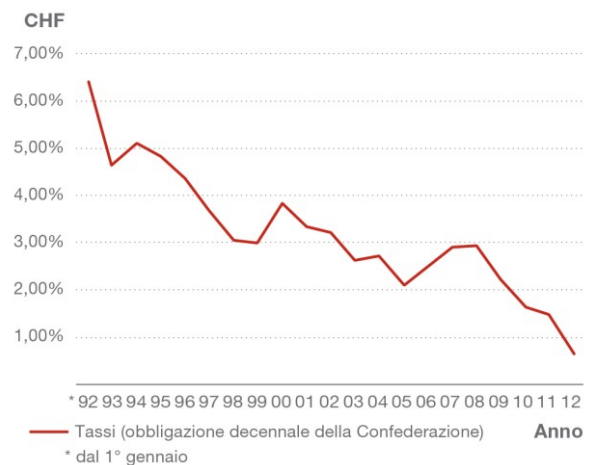
Andamento dei tassi su un'obbligazione decennale della Confederazione dal 1992 al 2012

Zone grigie = fasi di mercato in rialzo: il cliente partecipa Zone bianche = fasi di mercato in ribasso: il cliente è tutelato